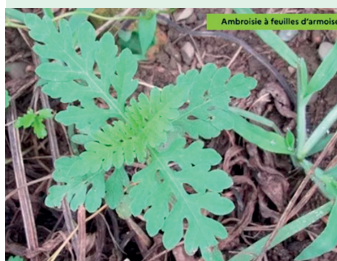
Ambrosie à feuilles d'armoise